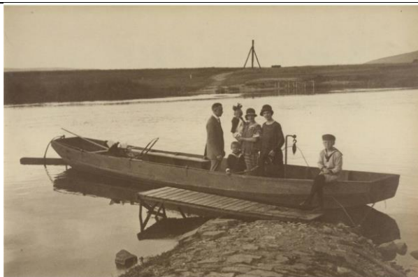
kleiner Fährkahn zur Personenbeförderung

Damit die Fähre an der gegenüberliegenden Anlegestelle ankommt, wurde sie im ruhigen Wasser durch Treidler (Bomätscher) gegen den Strom gezogen (getreidelt).