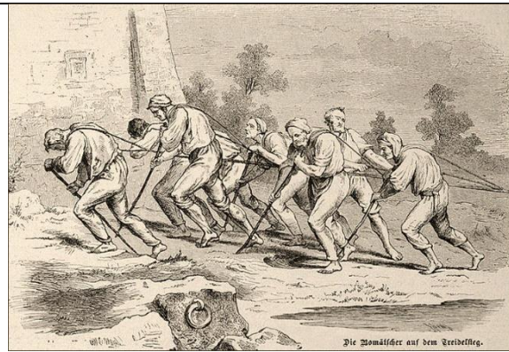
Treidler (Bomätscher) bei der Arbeit

Die Fähre wurde vom Fürstenhaus verpachtet. Der Verdienst eines Fährmanns war sehr niedrig; die Einnahmen deckten in etwa die Pachtkosten. Das Fährgeld war Verhandlungssache.