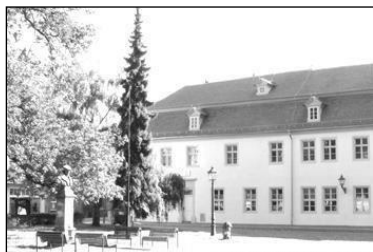
Bugenhagenhaus, Kirchplatz 9 Lutherstadt Wittenberg