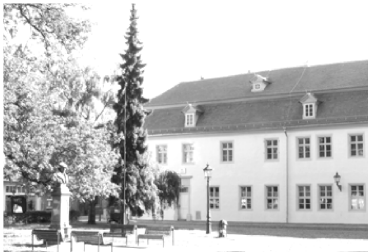
Bugenhagenhaus, Kirchplatz 9 Lutherstadt Wittenberg